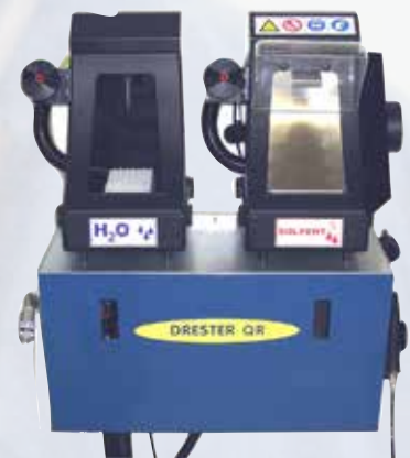
Drester QR-TT pour Eau et Solvant

L'utilisation de godets jetables s'est rapidement généralisée ces dernières années et continue de se développer.