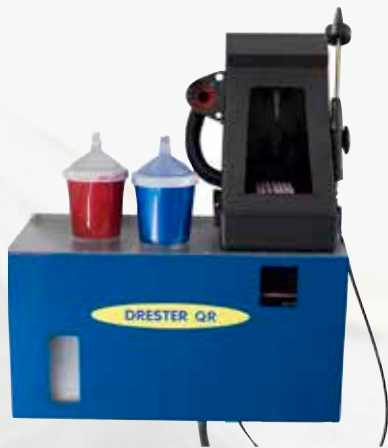
Drester QR-10 pour Eau