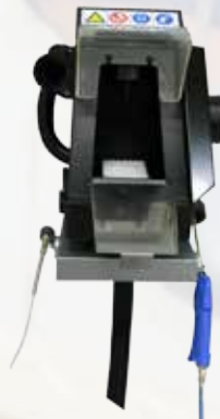
Drester QR-20 pour Solvant